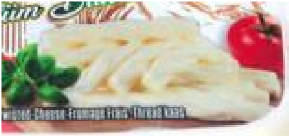
Ausschnitt zu „Büklüm Büklüm“