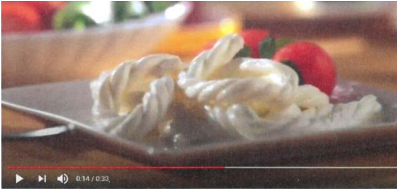
SUNTAT BÜKLÜM BÜKLÜM FADEN-KÄSE