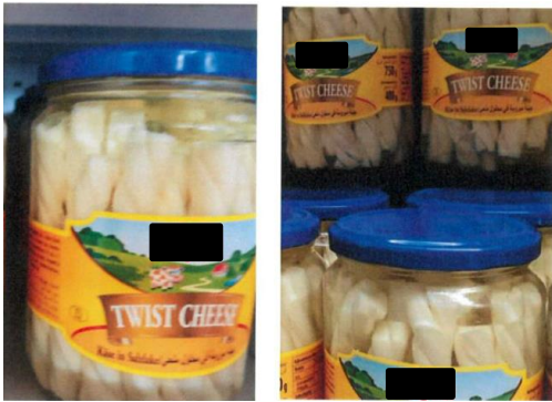
„H... Twist Cheese“

Allerdings hat die Beschwerdeführerin im Beschwerdeverfahren weitere Bilder zu geflochtenem/gedrehtem Käse vorgelegt, beispielsweise: