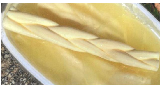
zu „Mini Örgü-Mujaddel“