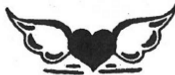
„Candice Cooper“ (MI)

Die Streitmarke übernimmt unmittelbar erkennbar wesentliche Elemente des älteren Bildmotivs, insbesondere das ausgefüllte Herz sowie die Proportionen der Flügel und des Bildzeichens insgesamt. Zugleich können die Änderungen des Bildelements, wobei die Flügel nicht mehr stilisiert („Flügelchen“ bzw. „Engelsflügel“), sondern schwarz ausgefüllt und an den Rändern „gefiedert“ dargestellt sind, unter Berücksichtigung des maßgeblichen Gesamteindrucks ohne Weiteres als Weiterentwicklung verstanden werden (so im Ergebnis auch schon OLG Köln, a. a. O., Az.: 6 U 37/16, juris). Denn da die Form des Herzens im Wesentlichen gleichbleibt und sich auch die Proportionen und äußeren Konturen der Flügel weiterhin stark